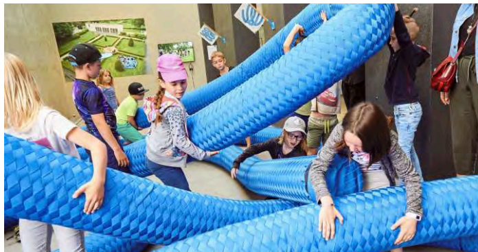
„Kunstaktionen“: Oberösterreichs Kulturquartier Linz

Im Vorverkauf ist das Ticket bei allen teilnehmenden Museen und Kulturinstitutionen am „Treffpunkt Museum“ zu erhalten. Es gilt zwischen 18 und 1 Uhr auch als Fahrschein für Shuttlebusse und – in Wien und Vorarlberg – für die öffentlichen Verkehrsmittel, einschließlich Nachtbusse. In Wien bieten die ORF-Lange Nacht und der Verband der Eisenbahnfreunde noch ein besonderes Vergnügen: eine Ring-rund-Fahrt mit einer Oldtimer-Straßenbahn, der „Lange-Nacht-Bim“ mit ihrem historischen Flair. Eine Tour, die über die Meisterbauten